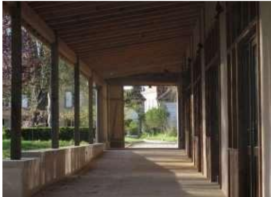
La Ruelle des ateliers