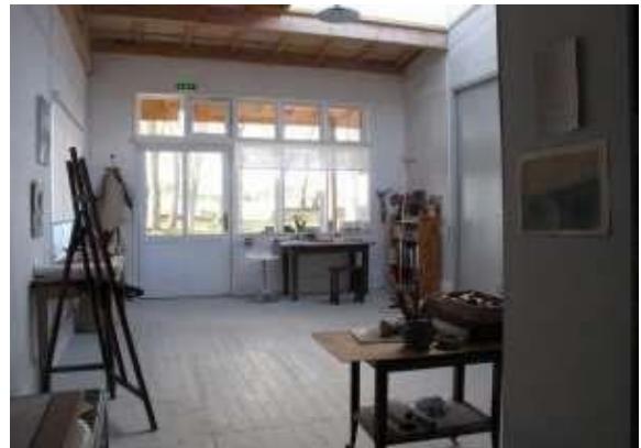
Les ateliers de création

Association Tournefou, 4, rue du Tournefou, 10190 Aix-Villemaur-Pâlis https://www.association-tournefou.com