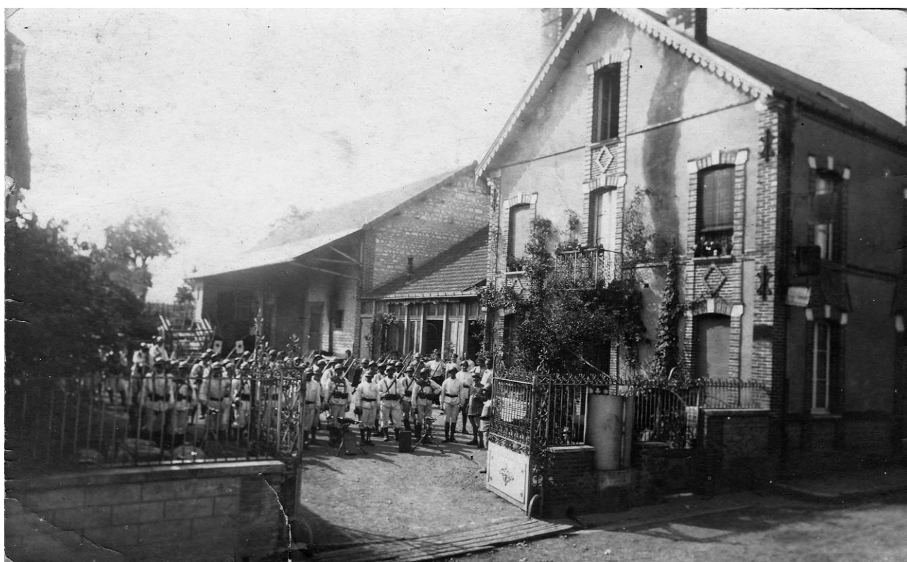
Figure 3: Groupement d'une compagnie de Tirailleurs algériens en tenue de corvée, dans la cour du Café Hôtel de Vosnon (10), vers 1918.

d'infirmierie dans le village de Sormery (89) avec unités combattantes coloniales (Tirailleurs algériens).